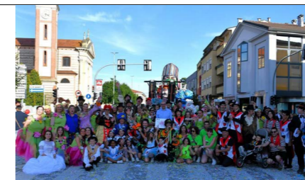
► Carnevale 2024 a Mestrino