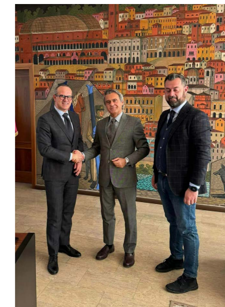
► La stretta di mano con il questore Marco Odorisio

tivamente i cittadini nella costruzione di una comunità più sicura e consapevole, - conclude il sindaco - e organizzeremo incontri regolari aperti alla cittadinanza per discutere e confrontarci su temi importanti come il bullismo, le truffe agli anziani e la violenza di genere». ♦