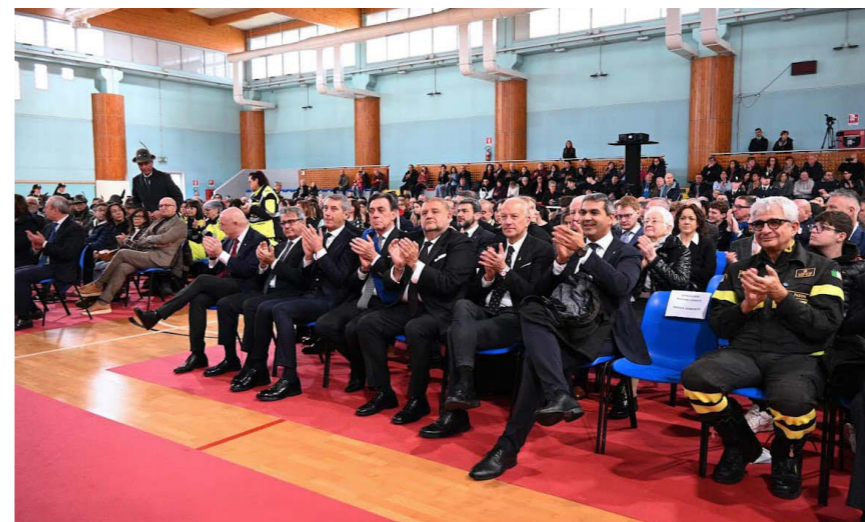
► Giornata cittadinanza

In occasione della Giornata della Cittadinanza davanti a più di 700 persone tra cittadini e cariche politiche e istituzionali è stato consegnato il certificato elettorale ai neodiciottenni classe 2015 , un'occasione speciale per andare oltre alla semplice formalità burocratica e con la quale si è voluto sottolineare il passaggio del giovani alla vita adulta, il loro ruolo attivo nella comunità, la loro responsabilità civica che andrà a concretizzarsi con l'esercizio del diritto di voto. La prossima cerimonia di consegna è prevista per gennaio 2025. ♦