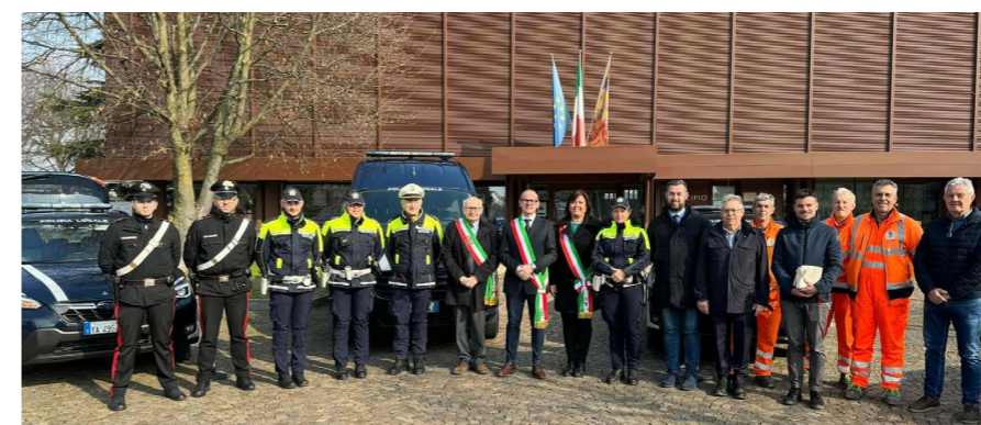
► L'inaugurazione dei nuovi mezzi