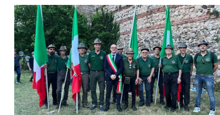
► Sindaco e Alpini al raduno di Vicenza