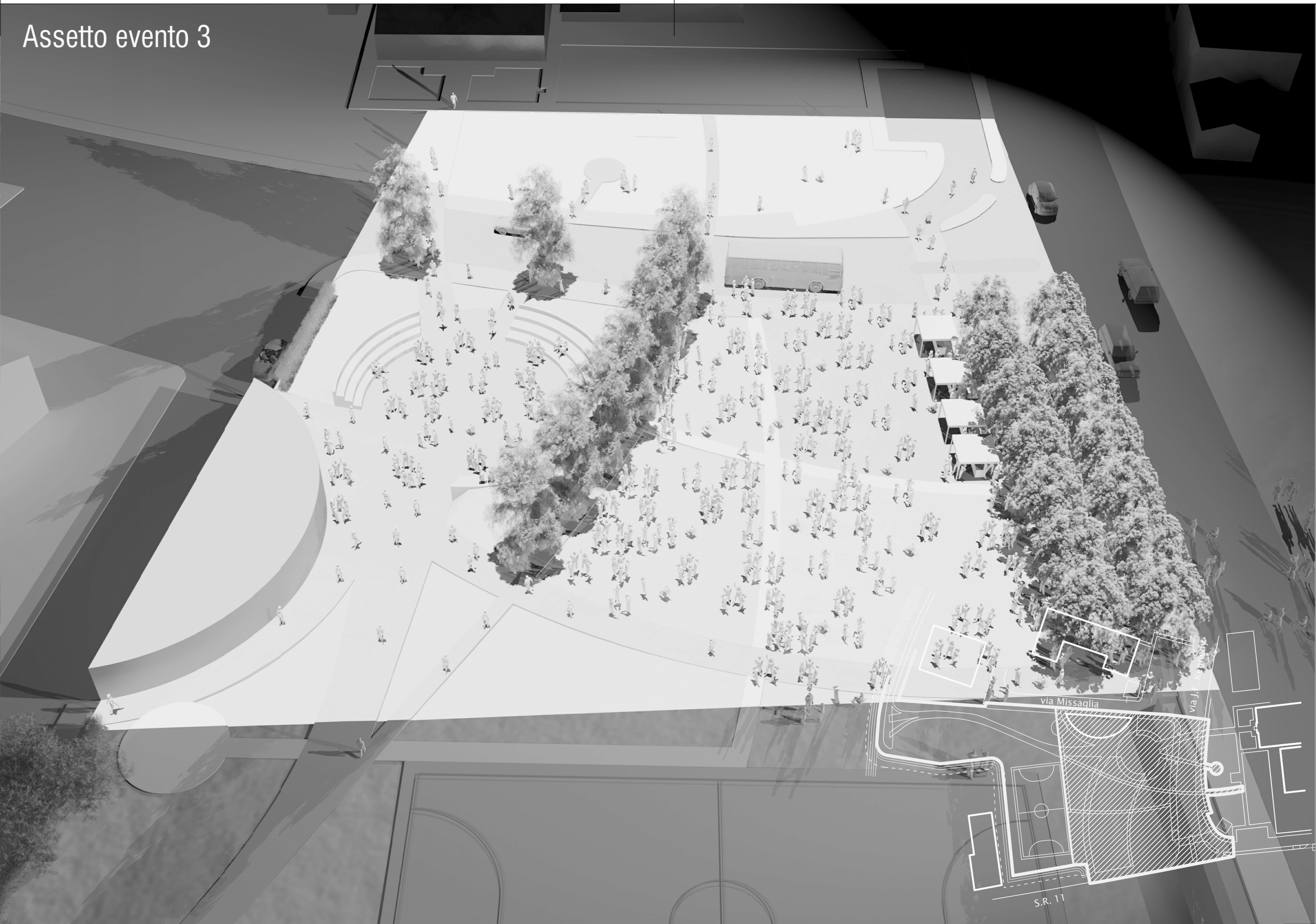
Assetto evento 3