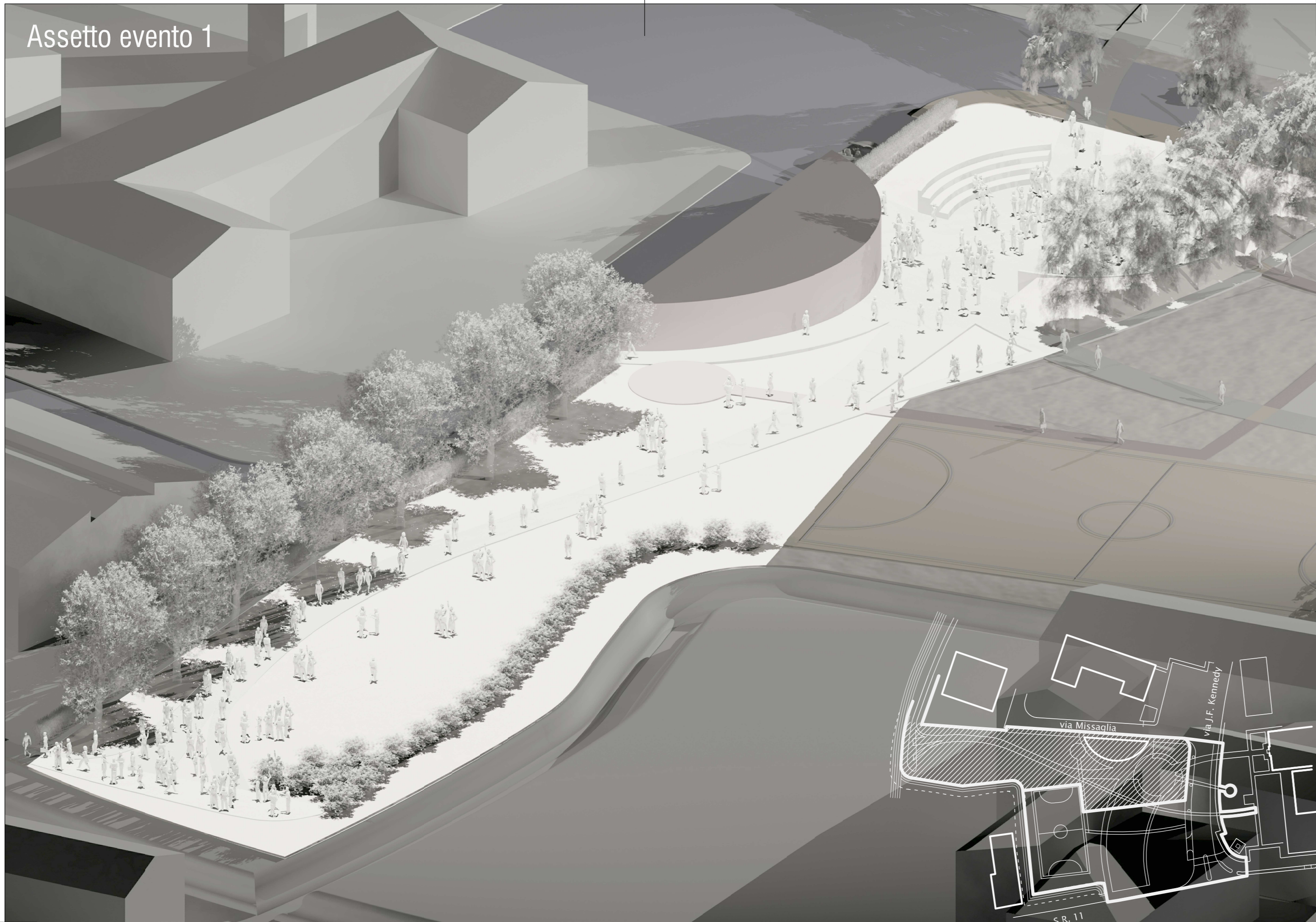
Assetto evento 1